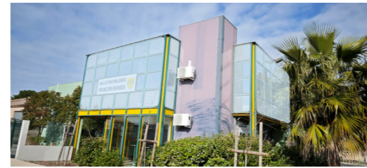
Réfection du premier étage

Sécurisation de l'entrée : du village côté Quarante.