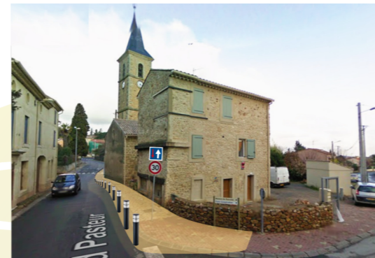
Sécurisation de l'accès à l'église