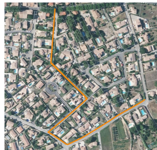
Aménagement d'un cheminement doux entre Av. de Béziers et le chemin de Combe Mouis