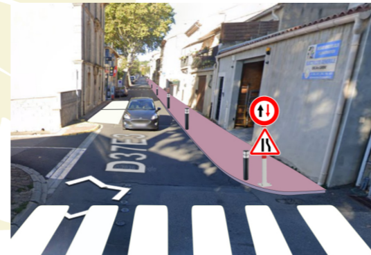
Mise en sécurité de L'av. de Béziers